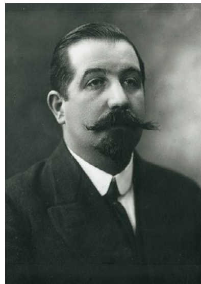
Léon JOUHAUX

Dans l'esprit des militants, c'est aussi par intérim qu'il est élu secrétaire général, deux mois plus tard.