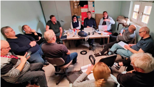
Secrétaires généraux FO Défense Metz, le 19 novembre 2025