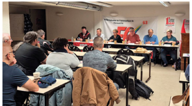
AG UL FO Défense Auvergne, le 25 novembre 2025