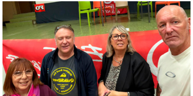
Réunion hopital Laveran Marseille, le 12 novembre 2025