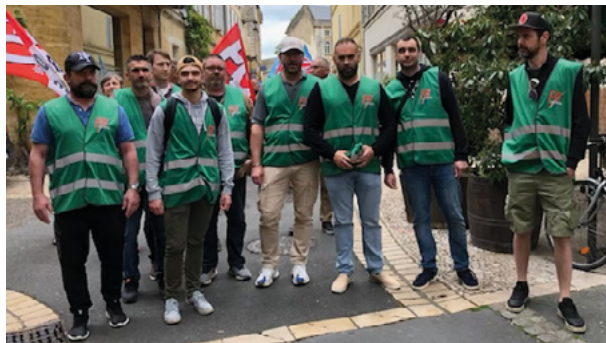
Syndicat FO Défense - Eurengo Bergerac

Il faudrait que les représentants FO des entreprises et industries de l'armement aient l'occasion de se