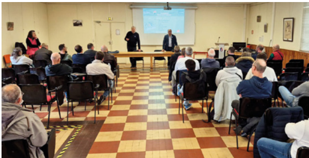
Réunion d'info au 2 e RMAT Bruz, le 13 novembre 2025