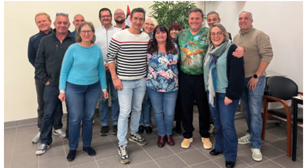
Militants FO Défense Bordeaux, le 19 novembre 2025