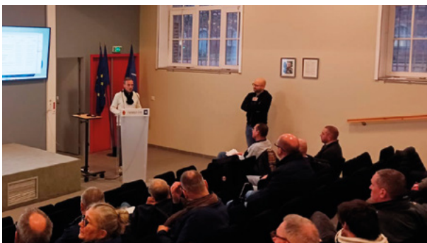
AG FO Défense Lille, le 20 novembre 2025