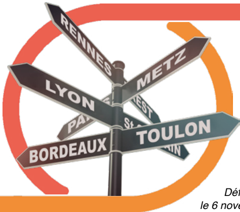
AG FO Défense Brest, le 6 novembre 2025