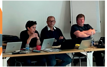
Conseil national UFSO 4 et 5 mars 2025