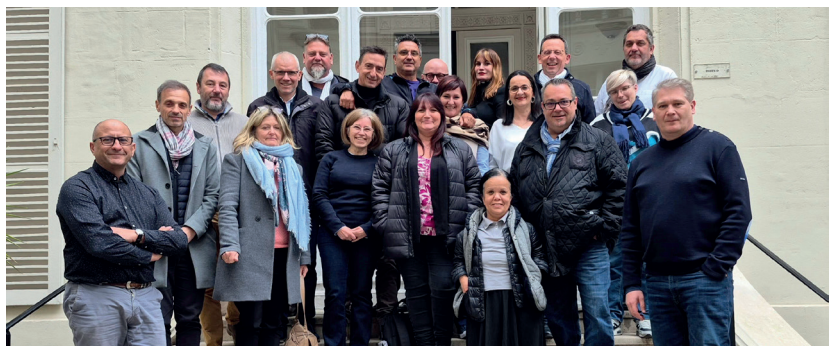
Réunion des représentants régionaux FO Défense le jeudi 13 mars 2025, à la Fédération