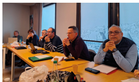
Conseil national commun des 22 et 23 janvier 2024.

nombreux travaux et réflexions de nos instances ; les nouvelles équipes pourront les poursuivre (ou pas !) sur les mêmes bases de discussions, à un rythme adapté et en passant peut-être par des étapes transitoires.