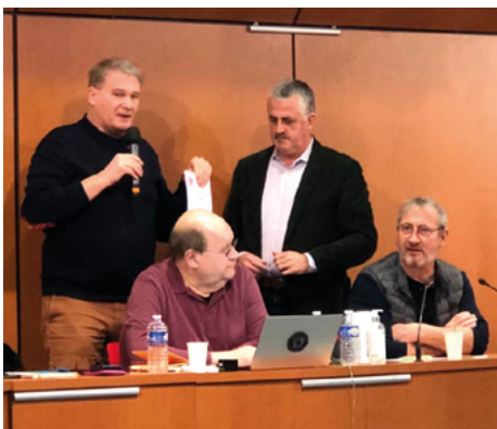
Commission exécutive du 14 février 2024 : remise des candidatures VP.

Le Conseil national, réuni à Paris le 23 janvier 2024, m'a mandaté à l'unanimité pour porter ma candidature au poste de secrétaire général de la fédération. Candidature mûrement réfléchie et portée par la structure.